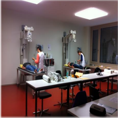
Sprechstundenassistentenz / Therapeutik (SSA/THE)